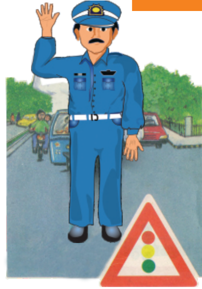
حق والے اشارے

سڑک پر ٹریفک کے اشارے نہ ہونے کی صورت میں ٹریفک پولیس کی ہدایات پر عمل کریں۔